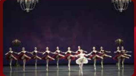
「パキータ」